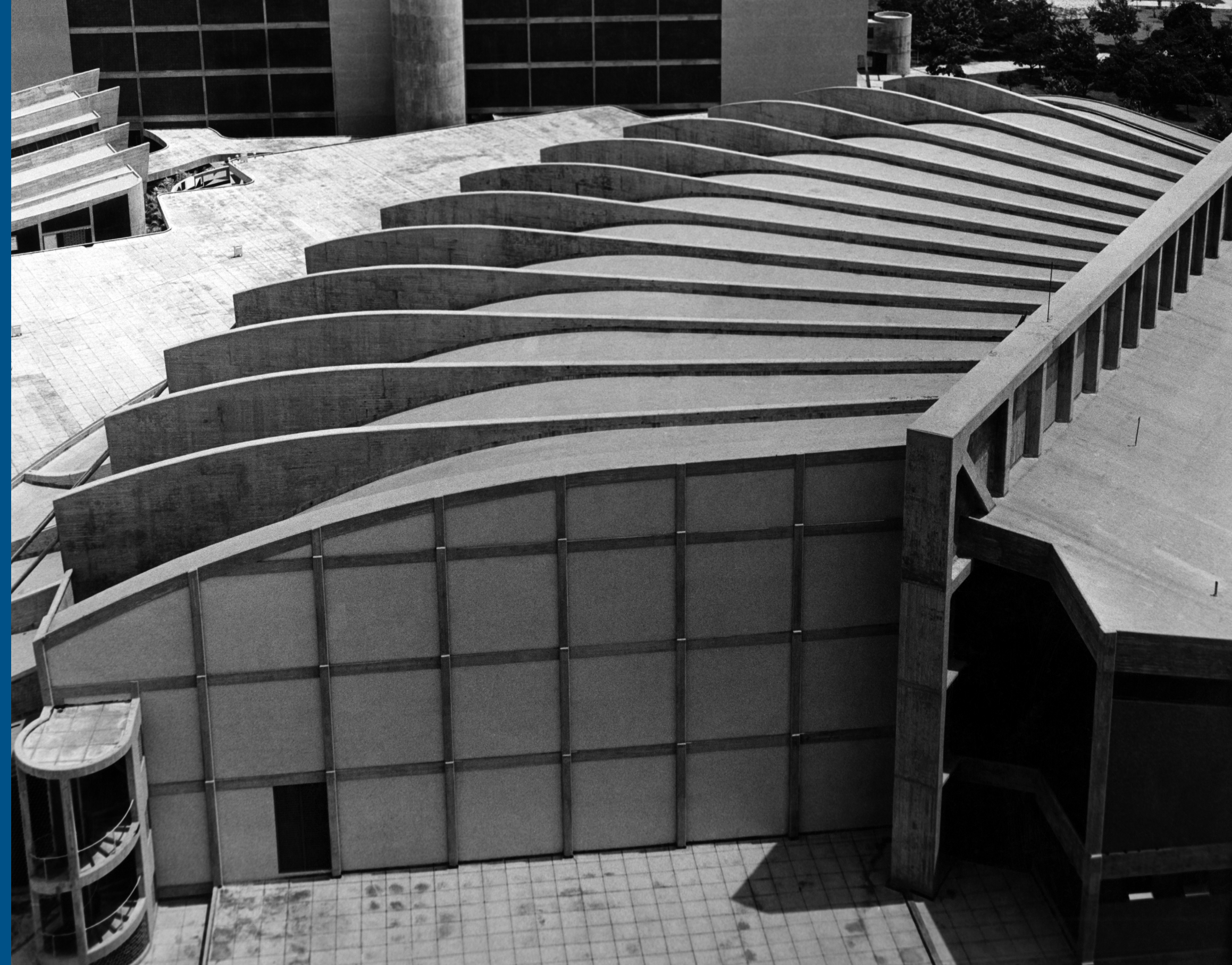
Vista aérea del Aula Magna Impresión Giclée en Hahnemühle Fine Atr Photo Rag 1954 ca.