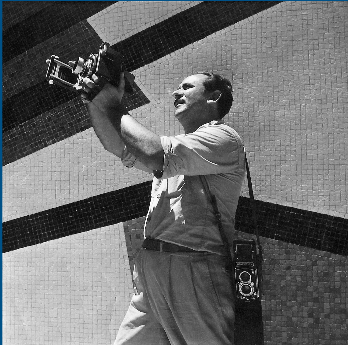
Leo Matiz en la Ciudad Universitaria de Caracas, Venezuela, 1954

En diciembre del año 2000 la Ciudad Universitaria de Caracas, considerada una pieza maestra de la arquitectura contemporánea y de la planificación urbana, fue declarada por la UNESCO como Patrimonio de la Humanidad. El proyecto de la Ciudad Universitaria surgió a comienzos de los años 40 en la antigua Hacienda Ibarra propiedad de Simón Bolívar y que este donara para que allí funcionara la Universidad Central de Venezuela, fundada como real y pontificia en 1721 pero reorganizada de acuerdo al ideal republicano.