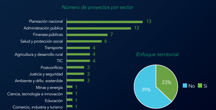
Figura 1.3-4. Número de proyectos desarrollados en la UCD por sector y por enfoque territorial